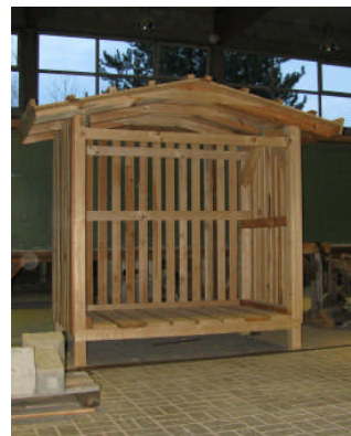
Ansprechende Holzkonstruktionen als Projektaufgabe

Die Schwerpunkthemen in den beiden Klassen sind jeweils fett hervorgehoben.