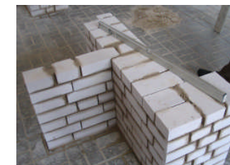
Werkstück der Zwischenprüfung: Der erste Schritt ist gemacht!

Im zweiten und dritten Ausbildungsjahr schließen sich die für diese Berufe wichtigen Lernfelder an. Nähere Informationen zu den an unserer BBS angebotenen Berufsschulklassen finden Sie auf unserer Internetseite oder sprechen Sie uns einfach persönlich an. Wir stehen Ihnen für eine Beratung gerne zur Verfügung.